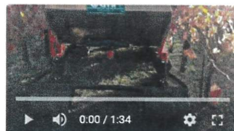
UČINKOVITO GNOJENJE ZATRAVLJENIH VINOGRADOV - življenje, zračnost in hranila