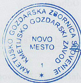
Damijan VRTIN Direktor KGZS - ZAVOD NM