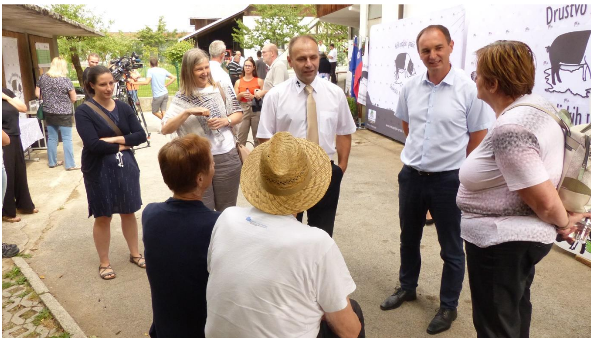
Predstavitev pasme in projektov na kmetiji Dežman, Radovljica