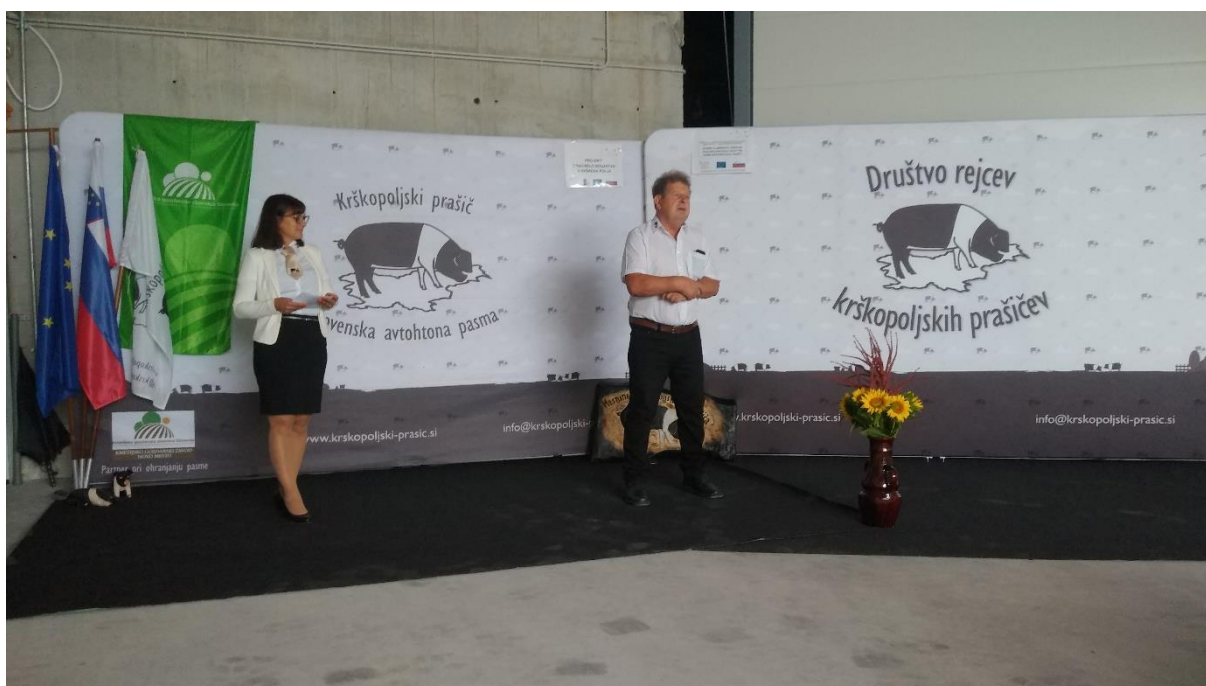
Predstavitev pasme in projektov na hišnem sejmu kmetije Žgajnar v Postojni