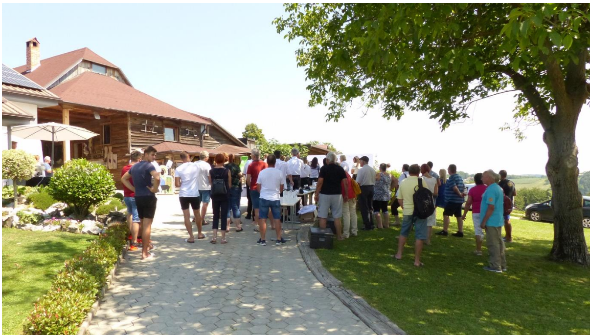
Predstavitev pasme in projektov na kulinaričnem sejmu kmetije Kamenik, Loče pri Poljčanah